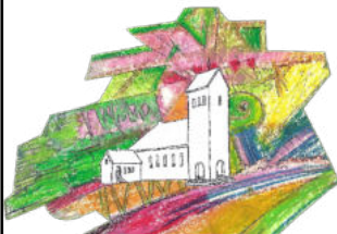
Ökokirche Deutzen e.V.